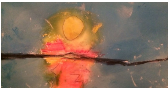
12-vuotiaan JNCL-tytön maalaus.

Tällä hetkellä NCL-tautia sairastavia lapsia/nuoria on noin 50 koko Suomessa.